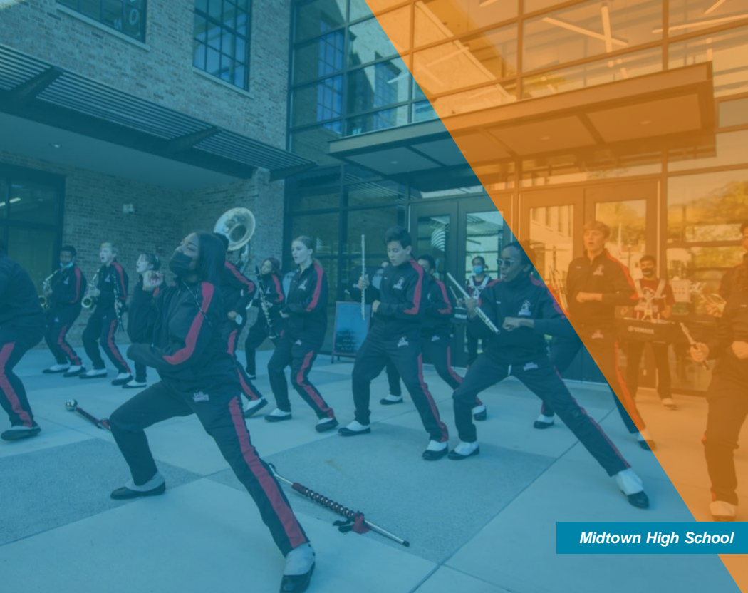
Midtown High School